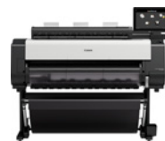
imagePROGRAF TX-4100 MFP Z36