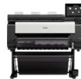
imagePROGRAF TX-3100 MFP Z36