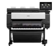
imagePROGRAF TX-3100 MFP Z36