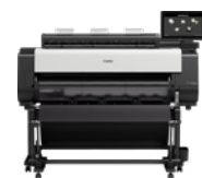
imagePROGRAF TX-4100 MFP Z36